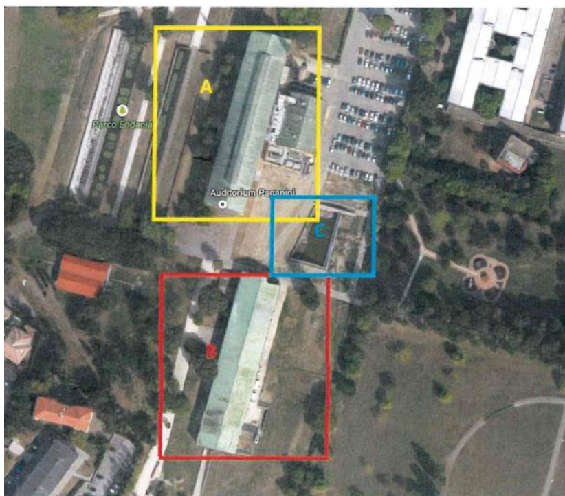
VISTA DALL'ALTO DELLE AREE IMPIEGATE DALLA FONDAZIONE ARTURO TOSCANINI

Di seguito viene riportata una vista aerea delle aree impiegate dalla Fondazione Arturo Toscanini.