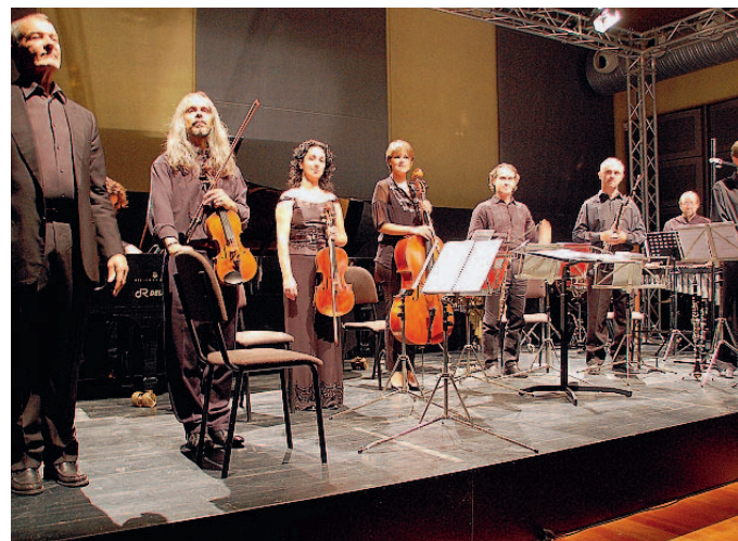
Applaudito il Divertimento Ensemble.

■ Nella ricca panoramica che la rassegna «Traiettorie» sta offrendo in questa edizione, con il consenso di un pubblico che si mostra sempre più attento e appassionato alle vicende della musica d'oggi, si è aperto l'altra sera un ampio scorcio interamente italiano, una prospettiva non poco interessante e accattivante che consentiva di osservare alcune linee di sviluppo che sono andate definendosi negli ultimi anni attraverso le proposte di un ensemble la cui immagine è oltremodo salda per l'affidabilità delle radici; sono infatti più di trent'anni che il Divertimento Ensemble esercita la sua autorevolezza quale testimone di una creatività che ha trovato una propria identità, pur