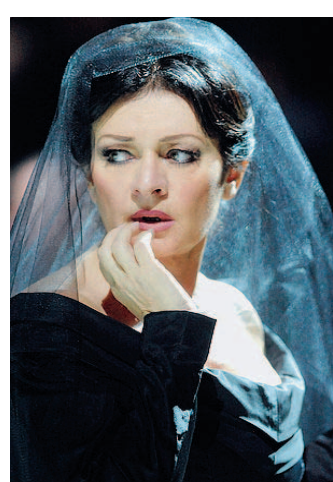
Daniela Dessì Soprano di fama.

La riflessione «L'opera è arte, come un dipinto. Non va modernizzata va rispettata»