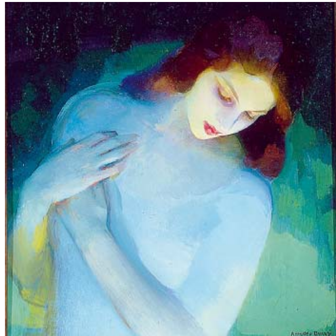
Amedeo Bocchi, «Annunciazione» L'immagine scelta per l'iniziativa.

Si tratta di un affascinante percorso in cui musica e pittura, pur essendo percepite da sensi differenti, potranno essere lette con i medesimi criteri. L'analisi guidata di importanti opere pittoriche, uniche nel loro genere, con visita alle sale della Galleria Nazionale