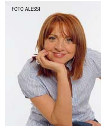
Debora Villa All'Arena del Sole.

Si legge in una nota: «Lo spettacolo che Debora Villa presenta a Roccabianca, divertentissimo, parte da poche e semplici domande: qual è la situazione della donna ai giorni nostri? E davvero cambiata dai tempi delle caverne o ci sono ancora inquietanti analogie con le nostre sorelle preistoriche? Come siamo finite qui? Da dove arriviamo? Chi siamo veramente? Secondo